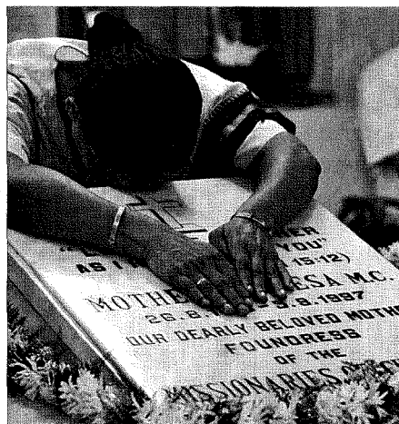
Una donna piange sulla tomba di madre Teresa di Calcutta