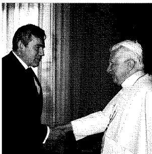
Benedetto XVI nella biblioteca privata con il premier britannico Gordon Brown durante l'udienza dello scorso 19 febbraio