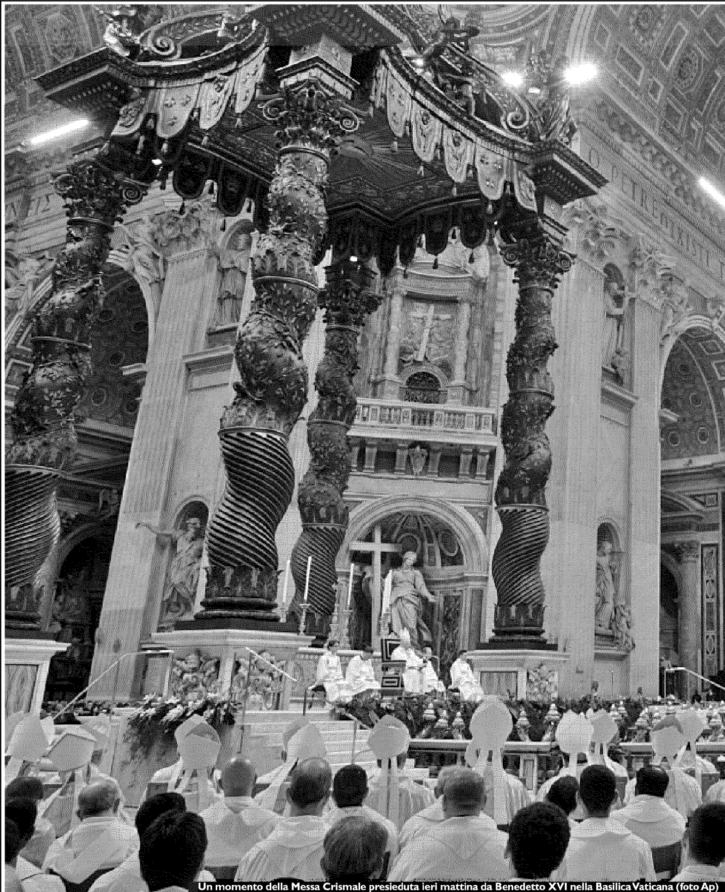
Un momento della Messa Crismale presieduta ieri mattina da Benedetto XVI nella Basilica Vaticana