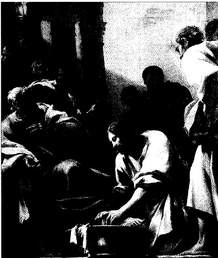
Simon Vouet (1590-1549) e bottega, La lavanda dei piedi

Ritaglio stampa ad uso esclusivo del destinatario, non riproducibile.