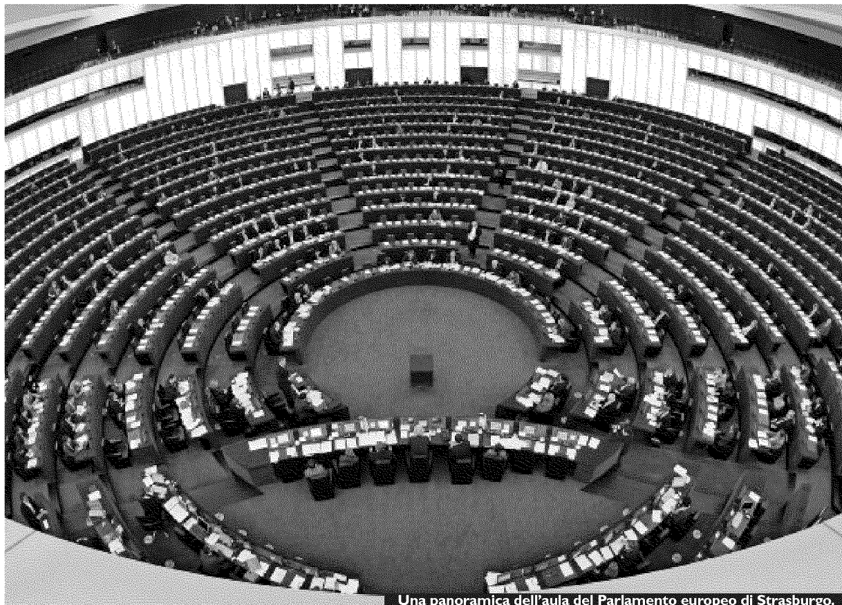
Una panoramica dell'aula del Parlamento europeo di Strasburgo.