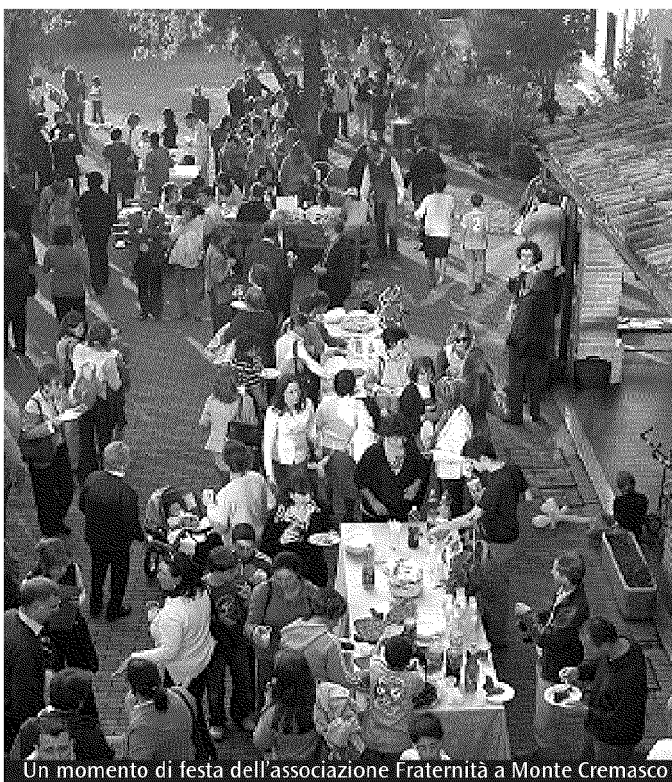
Un momento di festa dell'associazione Fraternità a Monte Cremasco

T ra le iniziative per festeggiare i 25 anni dell'associazione, la proiezione del documentario su alcune esperienze di accoglienza nate dall'associazione Fraternità. Intitolato «Un posto per tutti» e curato dal regista Emmanuel Exitu, è stato proiettato ieri sera a Crema, alla presenza dell'assessore lombardo alla Famiglia e Solidarietà Sociale, Giulio Boscagli. Stamattina presso la palestra Toffetti di Crema (parco Bonaldi) è in programma il convegno «Occorre amarli a uno a uno, totalmente e indistintamente. Storie di accoglienza», con interventi di Maurizio Sacconi, ministro del Welfare, Livia Pomodoro, presidente del Tribunale di Milano; del cardinale Ennio Antonelli, presidente del Pontificio Consiglio per la Famiglia, di monsignor Oscar Cantoni, vescovo di Crema, e di don Mauro Inzoli, presidente dell'associazione Fraternità. A seguire, le testimonianze di alcuni minori accolti dalle famiglie dell'associazione. La giornata si conclude con la celebrazione della Messa di ringraziamento (ore 16), celebrata dal cardinale Antonelli.