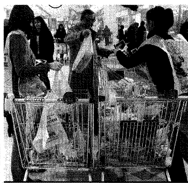
Foto: Ricerca della Fondazione per la solidarietà. - La povertà alimentare in Italia -

L'ispirazione arriva dalle Food Banks americane, oggi più di 200. In Italia la Fondazione Banco alimentare nasce nel 1989 dall'incontro tra il patron di Star, Danilo Fossati e don Luigi Giussani. Oggi coordina una rete di 8 mila enti sul territorio che hanno distribuito cibo gratis a 1,5 milioni di persone nel 2008 per un totale di 59.358 tonnellate. Evento clou la Giornata nazionale della colletta alimentare, nei supermercati l'ultimo sabato di novembre