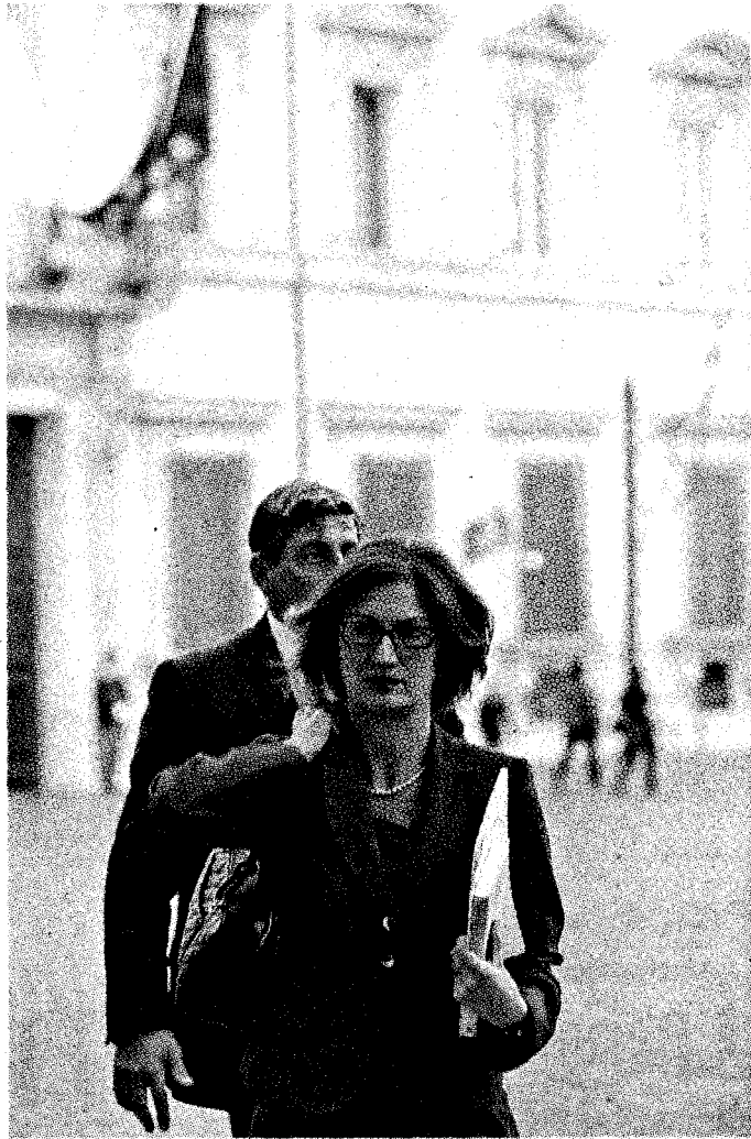
Il ministro dell'Istruzione Mariastella Gelmini