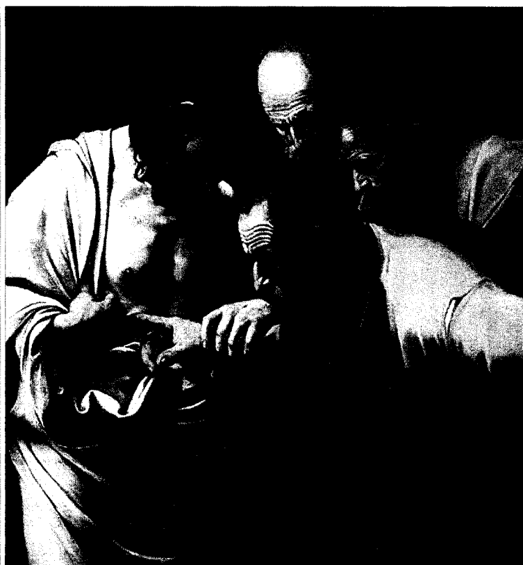
"Incredulità di san Tommaso", Caravaggio, olio su tela, 1601

Spesso s'identifica il razionale con ci  che pu  essere oggetto delle scienze e cos  Dio non lo si pu  conoscere razionalmente