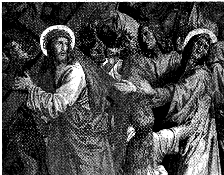
Le illustrazioni del libretto della celebrazione (edito dalla Libreria Editrice Vaticana) sono tratte dalla «Via Crucis» di Joseph Führich (1844-1846, Vienna, chiesa di San Giovanni Nepomuceno)