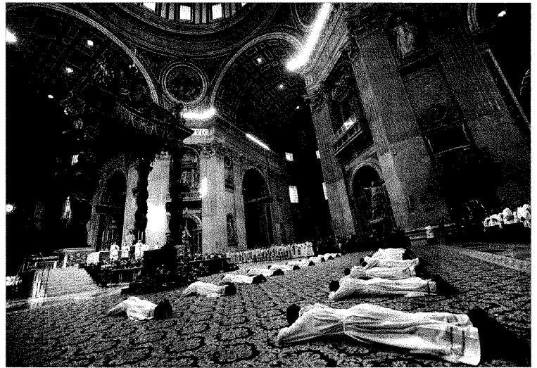
Papa Benedetto XVI celebra nella basilica di San Pietro la messa per l'ordinazione sacerdotale di 13 suoi preti. In alto: i preti che si preparano a una parte del rito. Sotto: dall'alto, i preti che si preparano a una parte del rito. Sotto: dall'alto, i preti che si preparano a una parte del rito. Sotto: dall'alto, i preti che si preparano a una parte del rito.