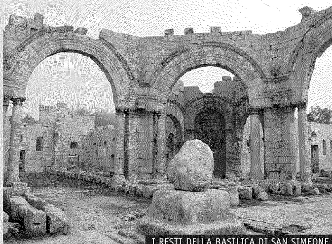
I RESTI DELLA BASILICA DI SAN SIMEONE