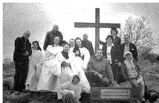
A sinistra, le suore al lavoro davanti al monastero di Nostra Signora Fonte della Pace. Sopra, con alcuni abitanti del villaggio davanti alla croce piantata in cima alla collina di Azeir. A fianco, la traduzione della liturgia in arabo. Sotto, preghiera nella cappella del convento

L'idea di insediarsi qui dopo l'eccidio dei monaci di Tibhirine in Algeria. Coltivano ulivi e l'orto, in progetto la lavorazione artistica del vetro; e poi la traduzione in arabo della liturgia «per essere dentro la vita di questo popolo»