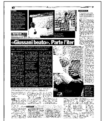
Un don Giussani sorridente alla lavagna durante una lezione. Sopra: il cardinale Angelo Scola, arcivescovo di Milano, ieri sera in Duomo