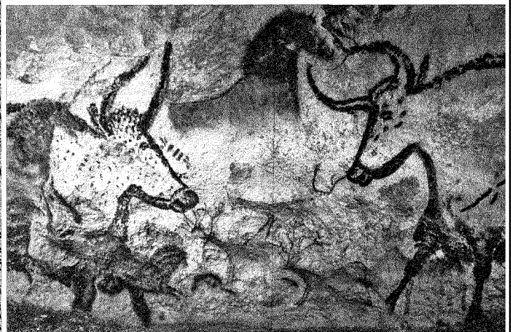
Graffiti raffiguranti tori nelle grotte di Lascaux, nella regione francese del Périgord

Figura umana che corre graffita su pietra di età neolitica (Parco nazionale delle incisioni rupestri della Valcamonica, Capo di Ponte)