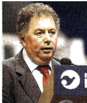
Presidente Giorgio Vittadini, 57 anni, guida la Fondazione per la sussidiarietà

il tema del futuro dell'Europa. L'Europa delle persone e dei popoli, che oggi si trovano nell'urgenza di riscoprire le grandi risorse di cui è ricca la loro storia e la loro esperienza presente, per affrontare la crisi e per costruire una unità non forzatamente politica o economica, ma basata sulla condivisione di ciò che in ogni cultura più sottolinea il valore di ogni uomo».