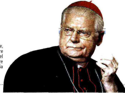
Angelo Scola, il Cardinale, 71 anni, ha iniziato a guidare l'Arcidiocesi di Milano nel settembre 2011, dopo essere stato Patriarca di Venezia

«Forse per il momento la voce di Milano è solo un balbettio, ma la speranza non è - come diceva Charles Péguy - la "virtù bambina"?»