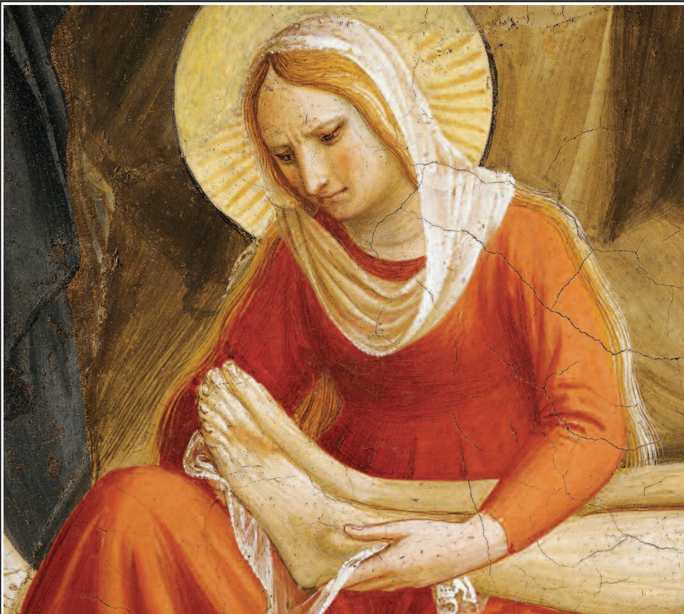
Compianto di Cristo morto.

» nella storia e che oggi, come ieri, l'uomo, ciascuno di noi, aspetta. «L'uomo di oggi», diceva don Giussani al Sinodo sui laici del 1987, «attende forse inconsapevolmente l'esperienza dell'incontro con persone per le quali il fatto di Cristo è realtà così presente che la vita loro è cambiata. È un impatto umano che può scuotere l'uomo di oggi: un avvenimento che sia eco dell'avvenimento iniziale, quando Gesù alzò gli occhi e disse: "Zaccheo, scendi subito, vengo a casa tua"» (L. Giussani, L'avvenimento cristiano , Bur, Milano 2003, p. 24).