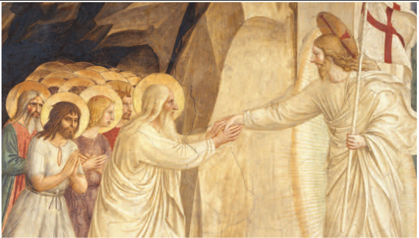
Discesa di Cristo al Limbo.

» le questioni aperte, perché è lì, quando recita le Lodi o quando fa silenzio o quando ascolta un amico o quando prende il caffè o quando legge il giornale, che è tutto teso a scoprire, a intercettare qualsiasi briciola di verità che possa venirgli incontro! Così tutto diventa interessante, perché se io non avessi la domanda, se io non avessi la ferita, se io non avessi un'apertura totale, nemmeno potrei rintracciarla, non me ne renderei neanche conto. Per questo il nostro è un «cammino umanissimo», non fatto di allucinazioni o di visioni, ma come partecipazione a una «avventura di conoscenza» che ci fa scoprire sempre di più l'attrattiva che c'è dentro qualsiasi limite, dentro qualsiasi difficoltà, perché qualsiasi obiezione o qualsiasi circostanza, pur dolorosa, ha sempre dentro qualcosa di vero, altrimenti non ci sarebbe.