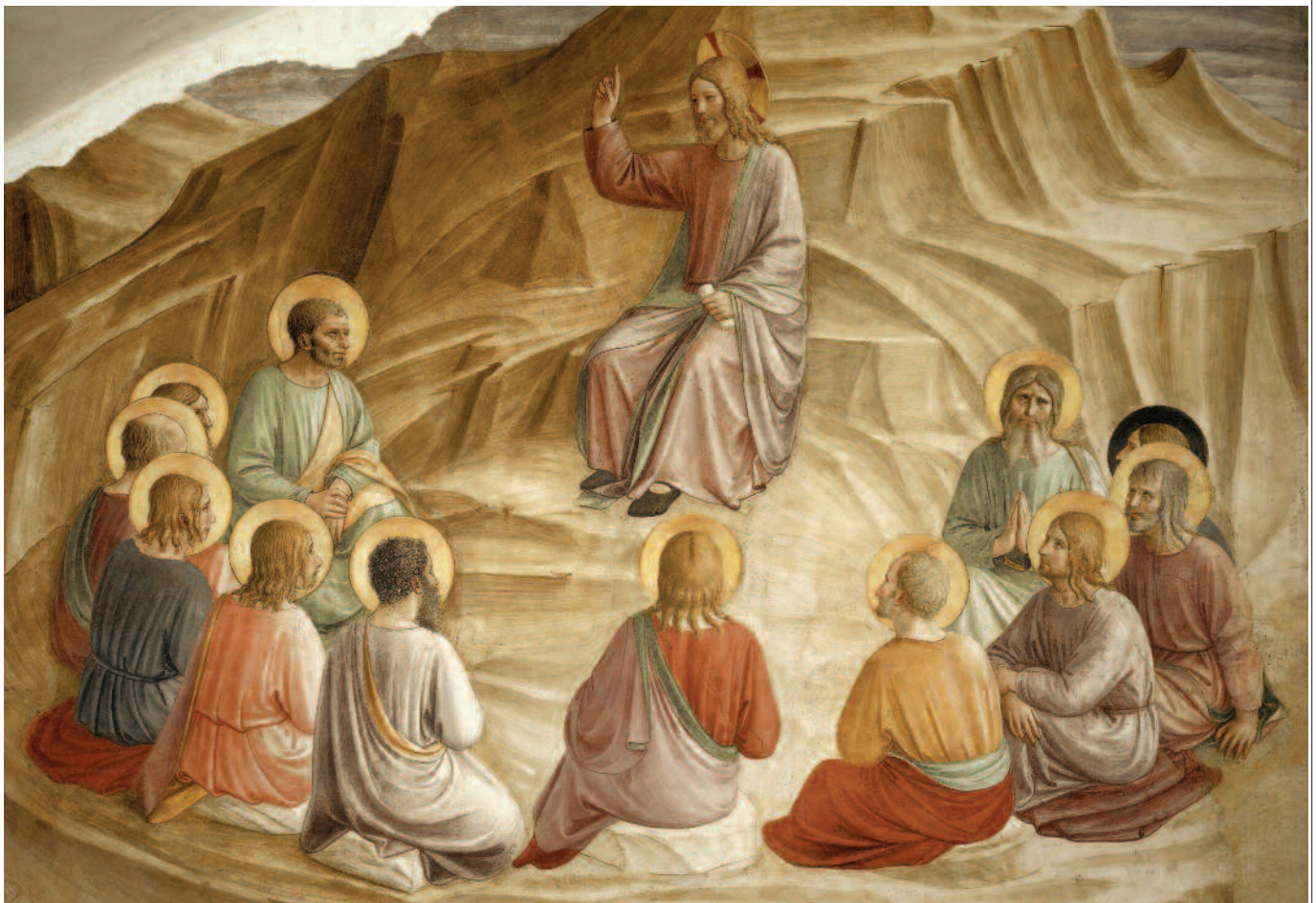
Sermone della montagna.

fusa (come diceva il Papa: «Non [...] fuga dal mondo o ricerca di qualsivoglia egemonia»!).