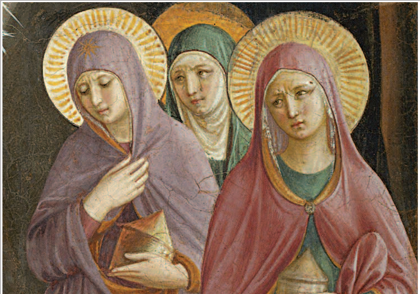
Pie donne al sepolcro.

» tà sentimentale, effimera, labile come foglia in balia del vento. E nella fedeltà al giudizio, cioè nella fedeltà alla fede, con l'età, tale attaccamento cresce, diventa più turgido, vibrante e potente».