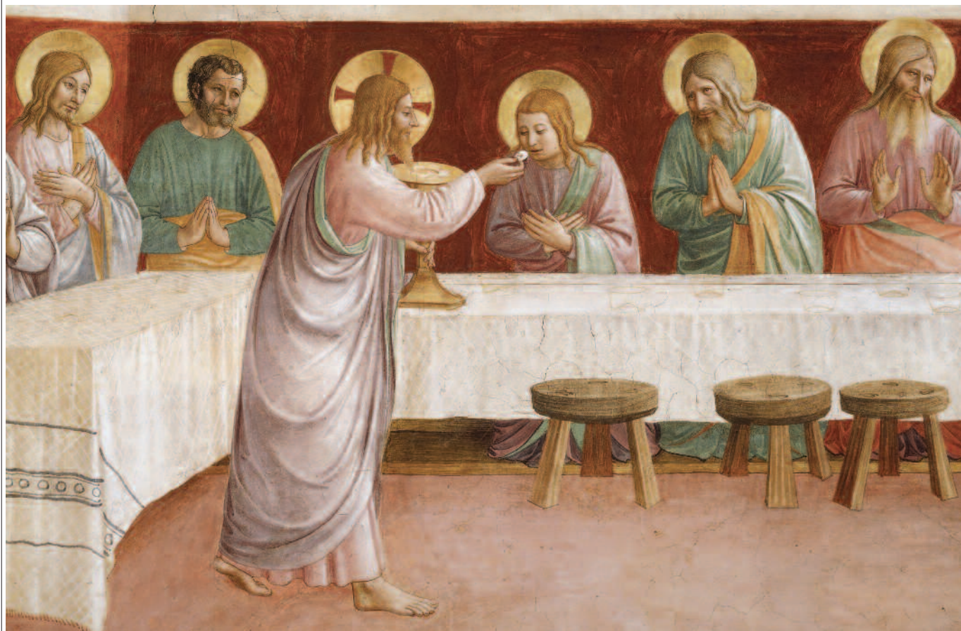
Comunione degli apostoli.

» no della nostra compagnia durante l'anno, in particolare in occasione dell'Assemblea nazionale dei responsabili di Cl a Pacengo, quando è diventato chiaro che veramente per noi il fattore di consistenza della vita è questa soddisfazione, per cui la certezza non è di uno che sa già tutto e poi, al limite, deve spiegarla agli altri, però in fondo per sé non si aspetta più niente, una certezza - diciamo - saccente, presuntuosa; no, la nostra è una certezza curiosa. È una certezza in partenza, che ci butta sempre in avanti. Riprendo ancora la lettera di papa Francesco: «Risulta chiaro che la fede non è intransigente, ma cresce nella convivenza che rispetta l'altro. Il credente non è arrogante; al contrario, la verità lo fa umile, sapendo che, più che possederla noi, è essa che ci abbraccia e ci possiede. Lungi dall'irrigidirci, la sicurezza della fede ci mette in cammino, e rende possibile la testimonianza e il dialogo con tutti» ( Ivi ).