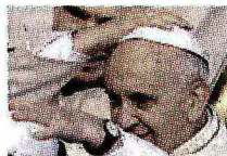
A PAGINA 23

Un inedito di Bergoglio Papa Francesco “La mia ricerca della verità”