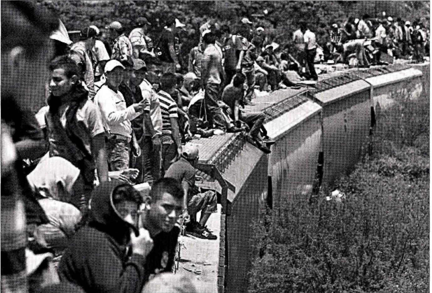
Migranti sul treno che attraversa la frontiera tra Messico e Stati Uniti

quella che ci dà la forza per benedire. E diciamo un'Ave Maria. Nostra Signora di Guadalupe, madre del Messico e madre dell'America, prega per noi.