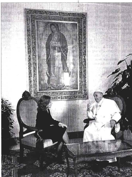
Volantina Alacrazi intervista Papa Francesco