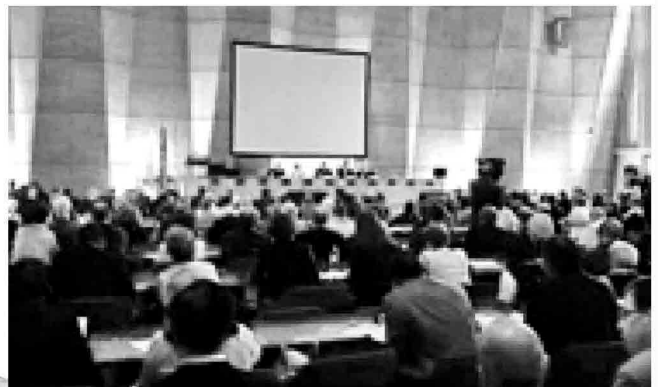
Il cardinale Parolin nel corso del suo intervento a Parigi

Ritaglio stampa ad uso esclusivo del destinatario, non riproducibile.