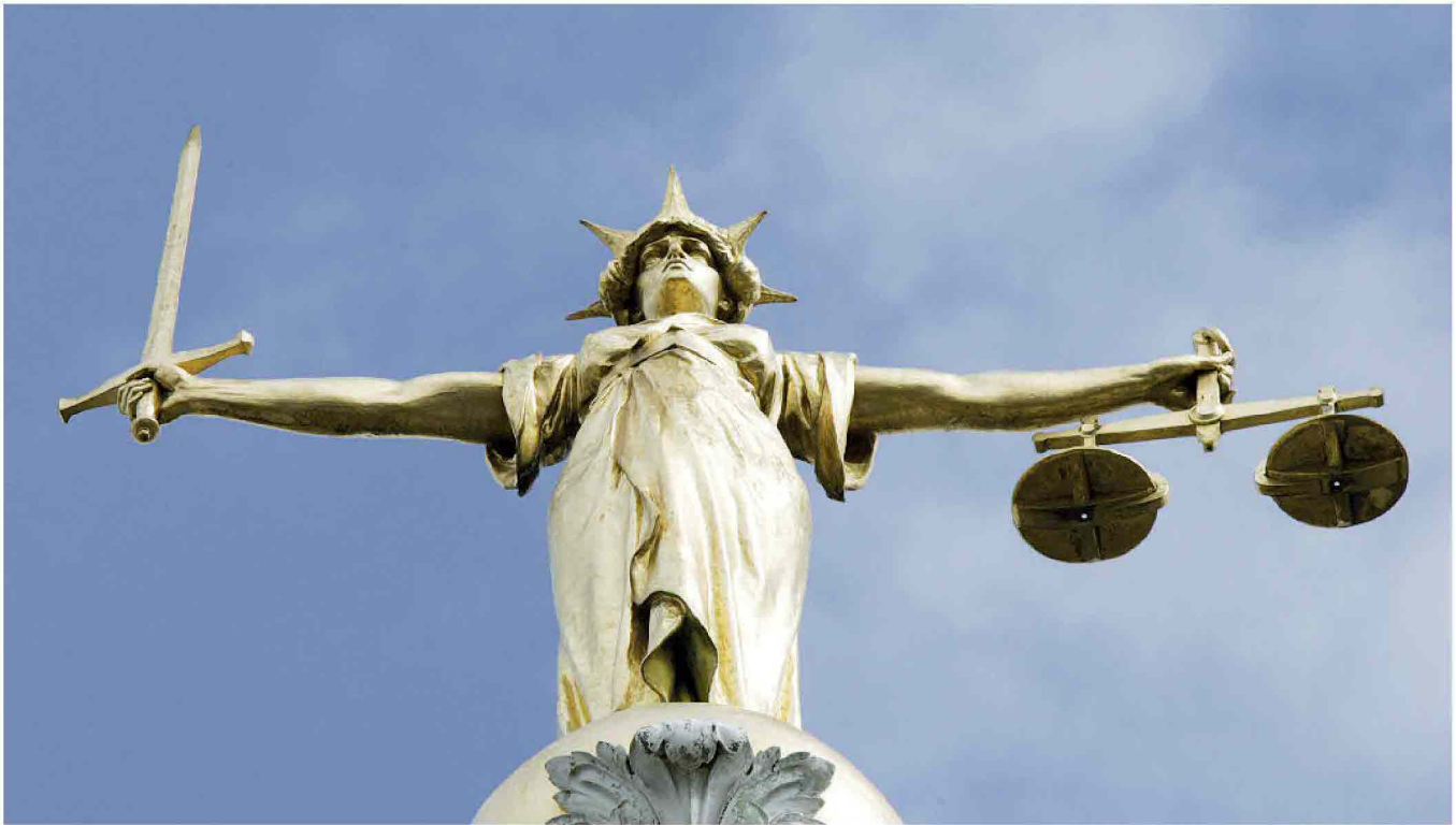
Londra. La statua della giustizia davanti all'Old Bailey, l'antico tribunale della capitale inglese