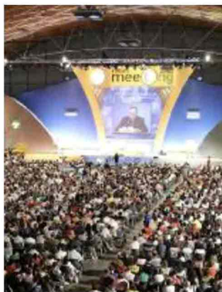
Il meeting di Cl a Rimini