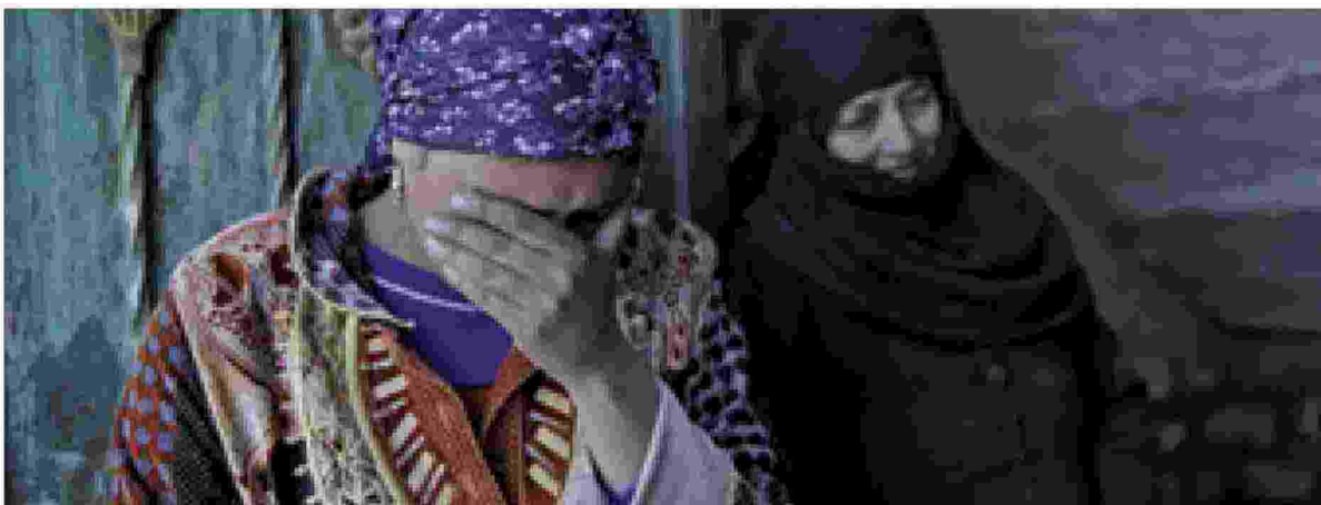
Cristiane copte di un villaggio a sud del Cairo

Ritaglio stampa ad uso esclusivo del destinatario, non riproducibile.