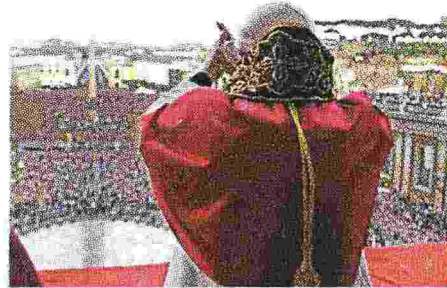
Papa Benedetto il giorno dell'elezione

Il compito più importante non sono gli “affari correnti” ma pregare per gli altri senza interruzione