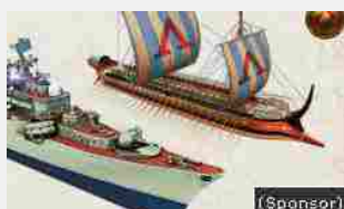
17/08/2016 Non farti beccare!!! Il tuo manager odierà questo gioco con tutto il cuore!