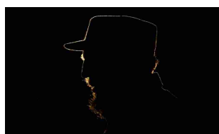
15/08/2013 Cuba: Fidel, Raul and the cardinal