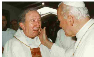
09/02/2013 Don Giussani, ricordi e testimonianze otto anni dopo