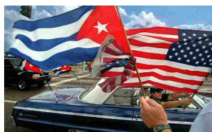
17/07/2015 Regreso de los Andes con un ojo puesto en Cuba