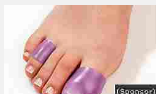
17/08/2016 Elimina l'alluce valgo... Niente più dolore ai piedi già dalla prima applicazione...