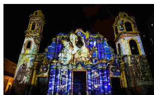
23/06/2016 Largo ai movimenti, nella Cuba che si apre al mondo