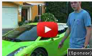
17/08/2016 Ricco con soli 1000 Euro. Come sono diventato milionario con 25000€ di entrate l...