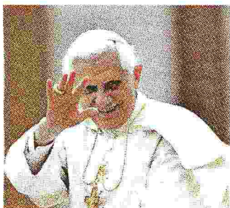
Ratzinger si è dimesso nel 2013

A ROMA il cielo è carico di nuvole minacciose ma quando arrivo a Mater Ecclesiae, la residenza del papa emerito, un inatteso raggio di sole esalta in basso l'armonia della cupola di San Pietro e dei giardini vaticani. «Il mio paradiso», aveva commentato in una precedente visita Benedetto XVI. Vengo introdotto nella sala che è contemporaneamente la biblioteca privata e mi viene spontaneo pensare al titolo del libro di Jean Leclercq, L'amore delle lettere e il desiderio di Dio , da Benedetto XVI citato nel famoso discorso al Chiostro dei Bernardini a Parigi.