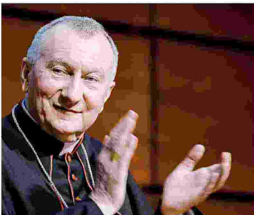
Il cardinale Pietro Parolin, segretario di Stato