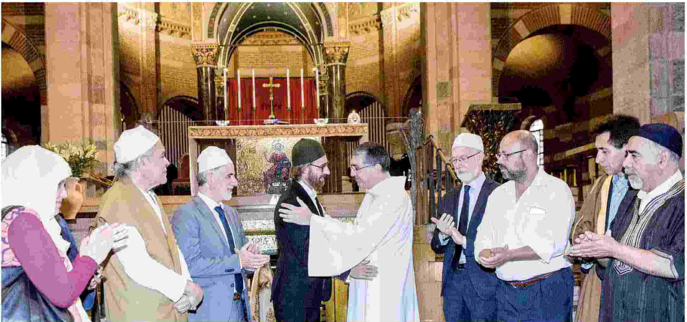
MILANO La presenza di esponenti musulmani alla Messa in Santa Maria in Caravaggio, all'indomani dell'omicidio del sacerdote francese a Rouen

contemporanea presso l'Università di Padova; e Stefania Falasca, editorialista di Avvenire e vicepostulatrice della causa di canonizzazione di Albino Luciani. Venerdì Parolin presiederà la Messa alle 16.30 sempre a Canale d'Agordo, cui seguirà l'inaugurazione della nuova sede del Museo Albino Luciani.