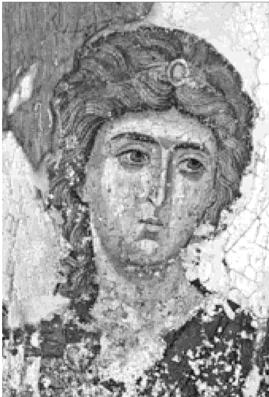
Arcangelo, (XII-XIII secolo) comunità di Latali, chiesa dell'Ascensione

Vi sono, infine, alcuni luoghi simbolici, che visiterà lo stesso Papa Francesco: innanzitutto la chiesa della Santa Croce (Jvari, in georgiano) a Mtskheta, la città santa della Georgia. L'antica, bellissima chiesa di Jvari sorge sul colle prospiciente il luogo del battesimo del popolo della Kartlia (antico nome della Georgia), nel punto in cui il re Mirian e santa Nino piantarono la prima croce in legno. Nella toponimica delle chiese di Mtskheta si incontrano molti nomi desunti dalla Terra santa (Getsemani, Tabor, Betlemme), dovuti al fatto che re Mirian e i suoi discendenti organizzarono la capitale a imitazione dei luoghi santi della Palestina, e in primo luogo di Gerusalemme. Centro della città è la maestosa cattedrale patriarcale Svetitskhoveli, che secondo la tradizione venne costruita sul luogo in cui era stata deposta la tunica del Signore e conserva al proprio interno una fedele ricostruzione dell'edicola del Santo Sepolcro, a testimoniare il legame inscindibile di ogni cristiano, di ogni chiesa, con il luogo benedetto della redenzione.