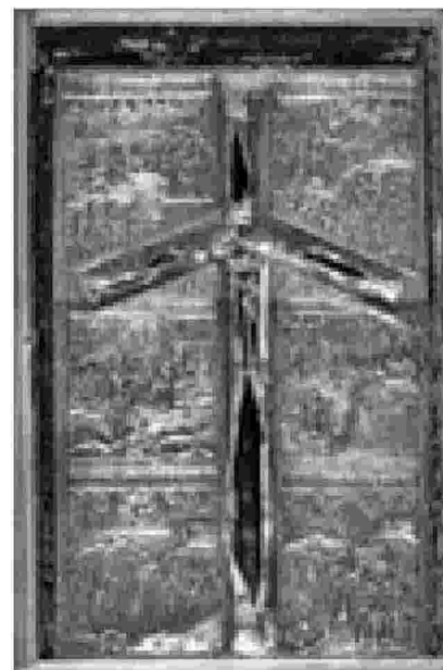
Croce di Santa Nino, simbolo della Chiesa ortodossa georgiana

Il simbolo per eccellenza della cultura georgiana precristiana è l'oro: la Colchide, regione occidentale della Georgia, è il mitico Paese del vello d'oro, alla cui ricerca si avventurano gli Argonauti guidati da Giasone. L'oro, inoltre, è strettamente legato al fuoco, necessario alla sua lavorazione: e al fuoco è legato il secondo simbolo della Georgia, espresso dal mito di Prometeo, incatenato dagli dei