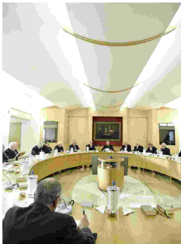
Ieri il via ai lavori del Consiglio episcopale permanente

Vediamo aumentare la distanza fra ricchi e poveri; lo stesso ceto medio è sempre più risucchiato dalla penuria dei beni primari, il lavoro, la casa, gli alimenti, la possibilità di cura