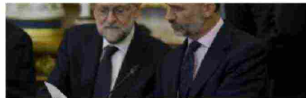
"Superar las embestidas requiere más habilidad que superar la investidura"