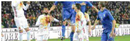
La abolición de las obligaciones