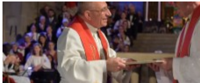
El ecumenismo de la conversión