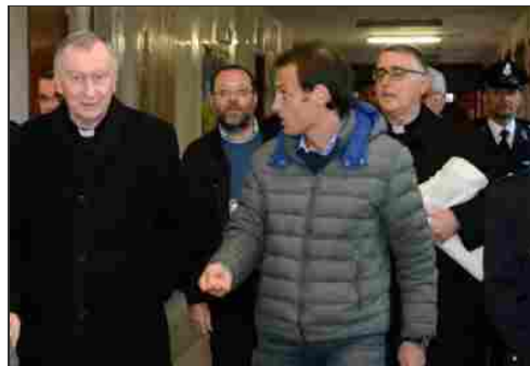
Il cardinale Parolin (a sin.) in un braccio del carcere Due Palazzi

Sono i vostri volti a raccontarmelo: il tempo del carcere li ha messi a dura prova ma la luce non si è ancora spenta. Rimane accesa perché qualcuno la tiene accesa: i vostri figli, le vostre donne, i vostri affetti. Qui dentro state portando avanti una battaglia per gli affetti: il mio invito è che la continuiate perché è solo con l'amore che l'uomo diventa diverso, anche migliore di quello che era. E assieme a voi, che siete la vera ragione del carcere, la speranza ha il volto di chi vi vuol bene in questo momento della vostra vita. Penso alla parrocchia di questo carcere: è meraviglioso sapere che, soprattutto in questo Anno della Misericordia, qui ogni domenica entrano gruppi di persone, assieme ai loro sacerdoti. E' solo incontrandovi-dal-vivo che le idee possono cambiare, i pregiudizi cadere. Ringrazio quelli che fanno dono della loro storia nelle testimonianze: sento che quei racconti fanno del bene in chi li ascolta, anche se non è cosa facile raccontare le proprie cadute. Chi ci riesce, però, ti infonde la sensazione che la resurrezione abbia