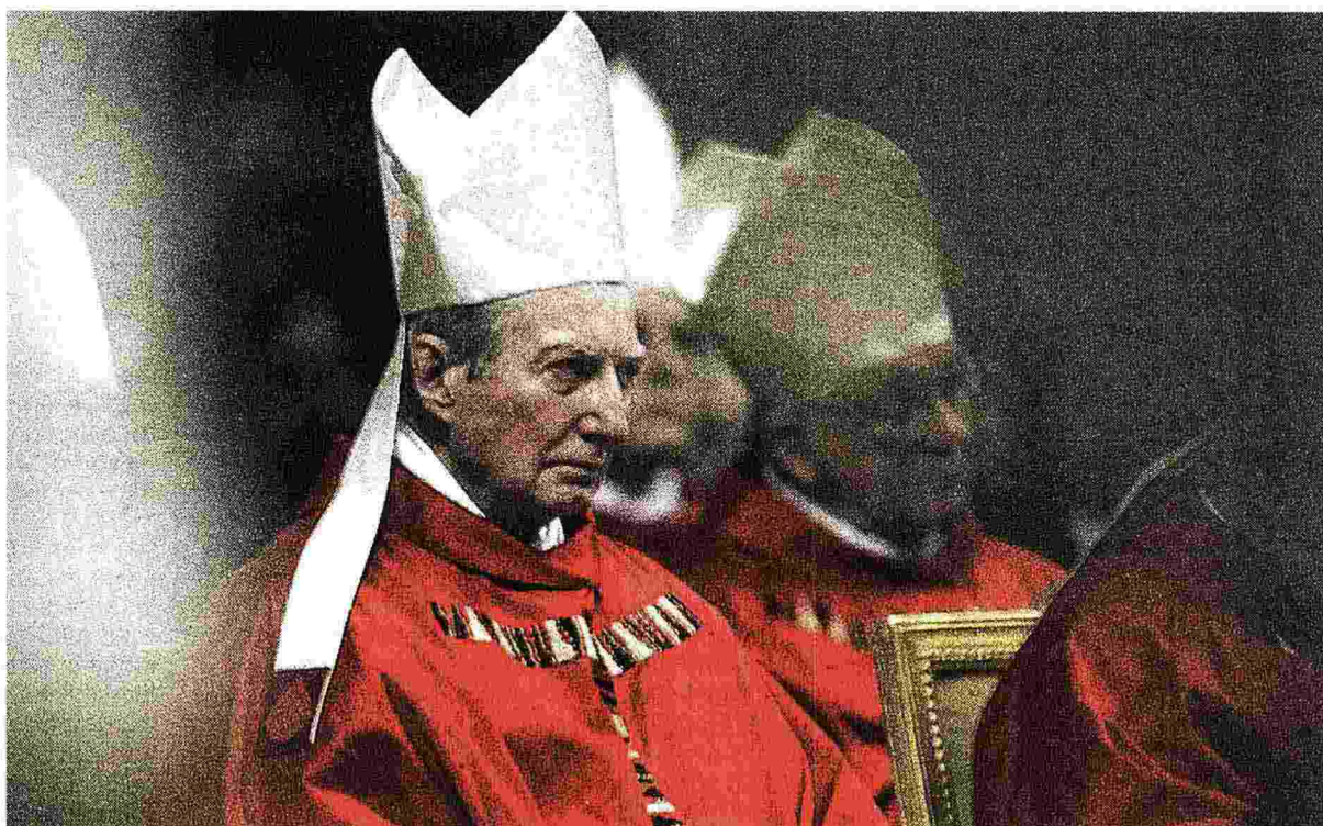
In Vaticano Carlo Maria Martini nel 2005 a Roma. Cardinale per 22 anni a Milano, è morto a Gallarate nel 2012 all'età di 85 anni

● «I verbi di Dio» di Carlo Maria Martini (Edizioni Terra Santa) sarà nelle librerie dal 23 marzo