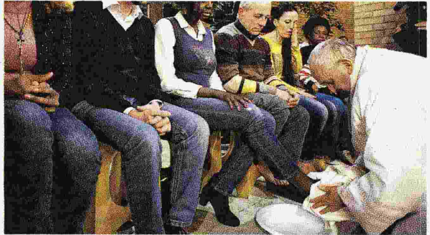
La lavanda dei piedi ai detenuti di Rebibbia, alla vigilia della Pasqua di due anni fa