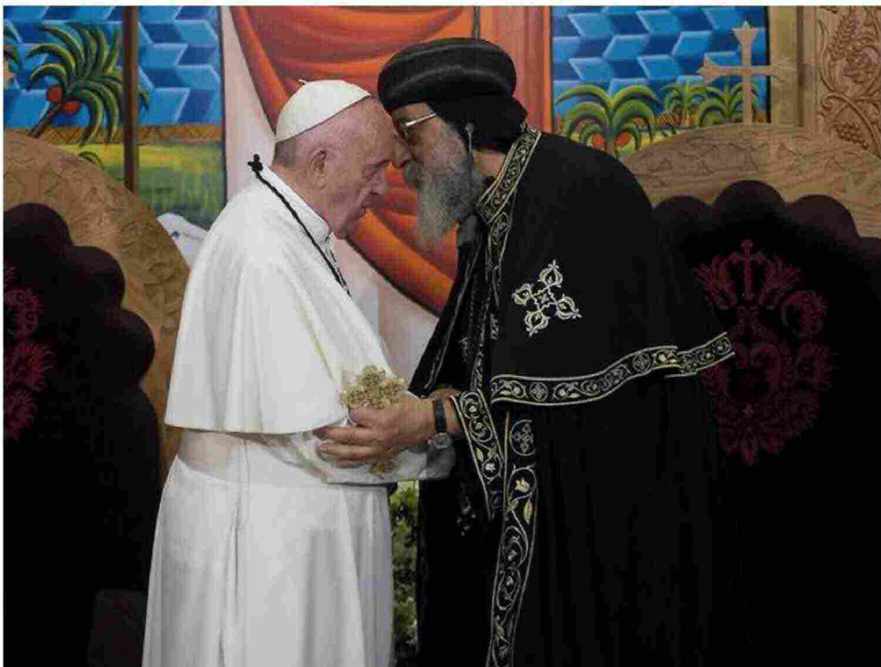
El papa Francisco y el papa Tawadros II en El Cairo, abril de 2017.

Si el diálogo interreligioso emprendido por el papa con el mundo musulmán y el diálogo ecuménico abierto con los coptos siguen dando pasos, saldrá ganando la convivencia en Egipto y en Oriente Medio, se verá favorecido el respeto a la dignidad de las personas y crecerá la expectativa de paz y de progreso social en el mundo durante este siglo XXI, que ya acumula muchos sufrimientos y amenazas en sus escasos dos primeros decenios de vida.