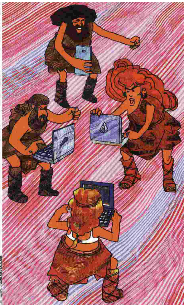
ILLUSTRAZIONE DI GIANCARLO CALCHI NOVATI