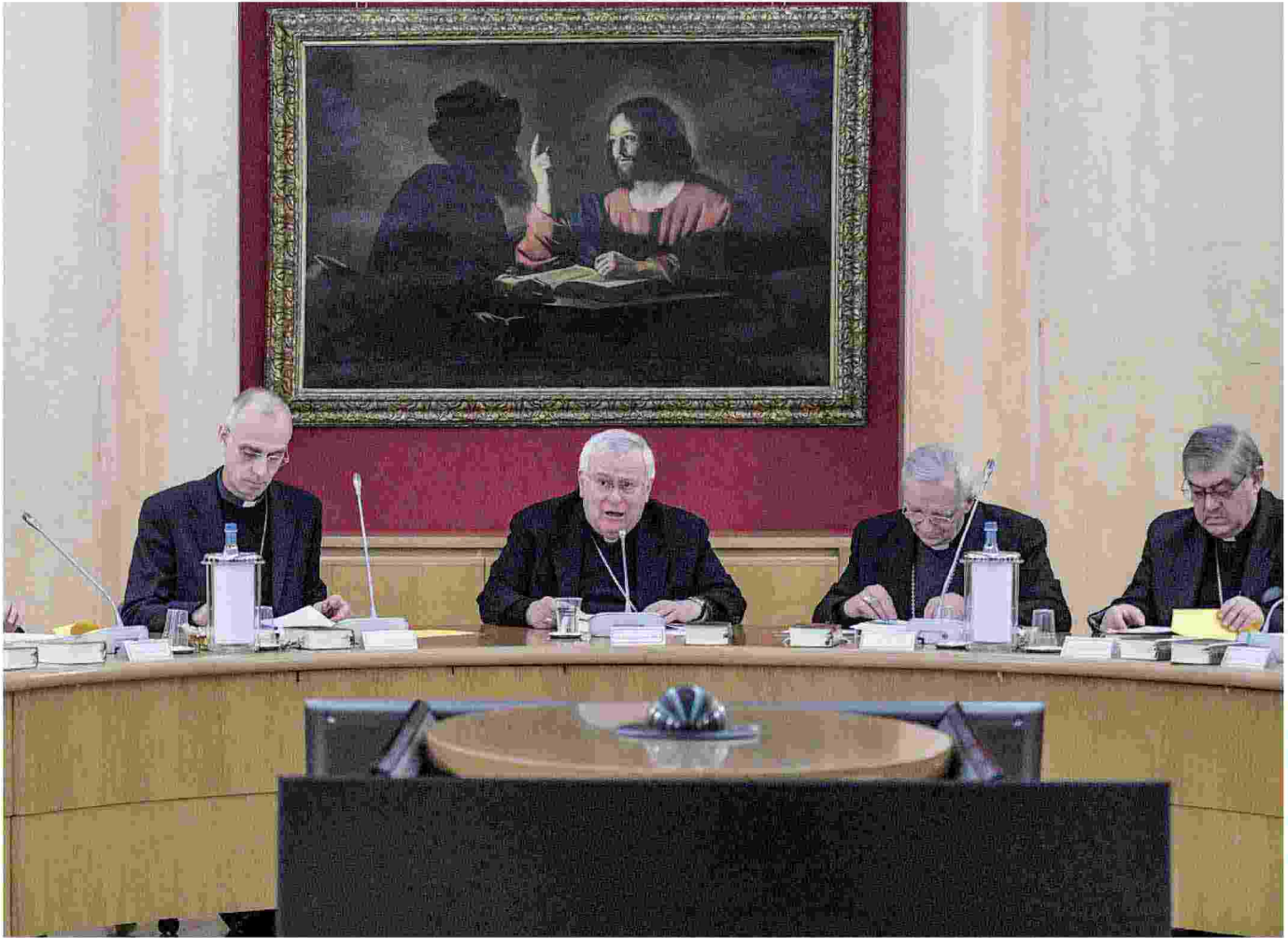
A Roma l'introduzione del cardinale presidente Bassetti ha aperto i lavori del Consiglio permanente della Cei.