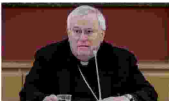
Il cardinale Gualtiero Bassetti

«Governare il Paese significa servirlo e curarlo. No all'ordine fine a se stesso»