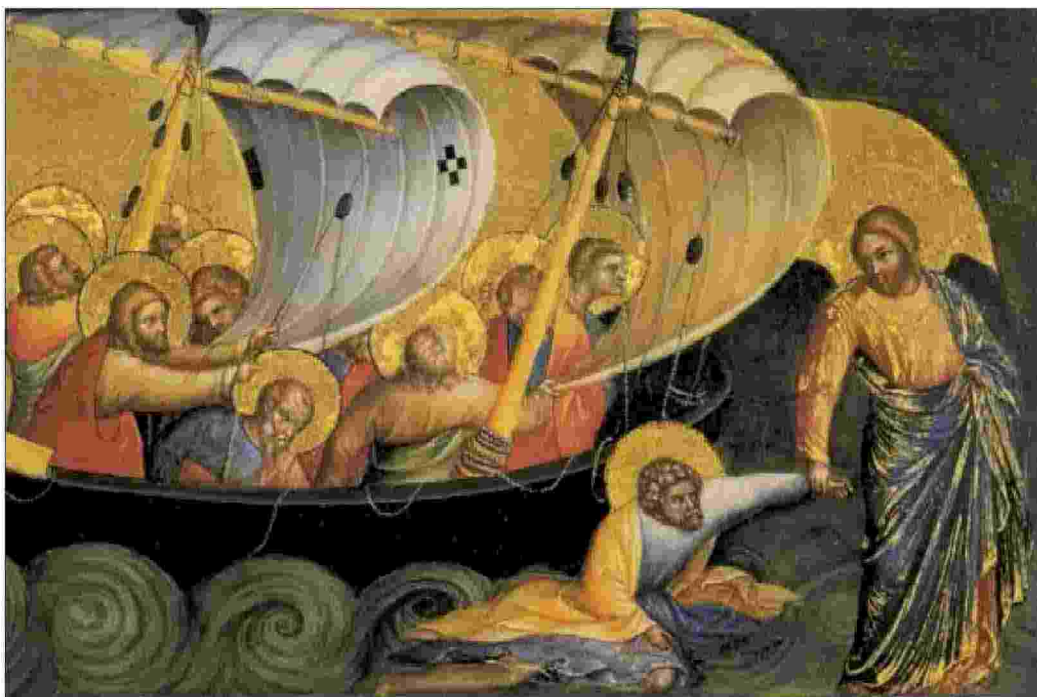
Lorenzo Veneziano, «Gesù salva Pietro» (particolare, 1370)