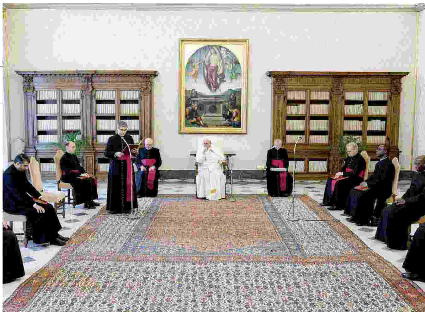
L'udienza generale di ieri senza fedeli

La catechesi del Papa traccia i segni dell'orazione cristiana: è il primo desiderio della giornata, un'arte da praticare con insistenza, da svolgere in solitudine percependo che tutto viene da Dio e a Lui ritorna