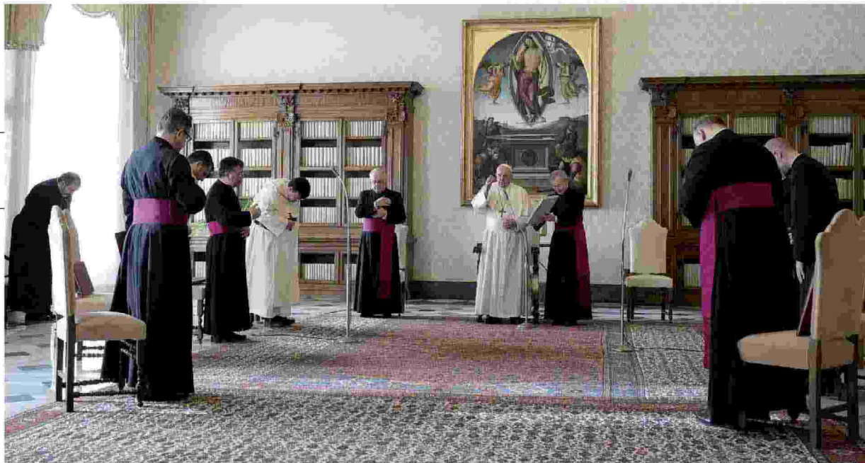
L'udienza generale di ieri