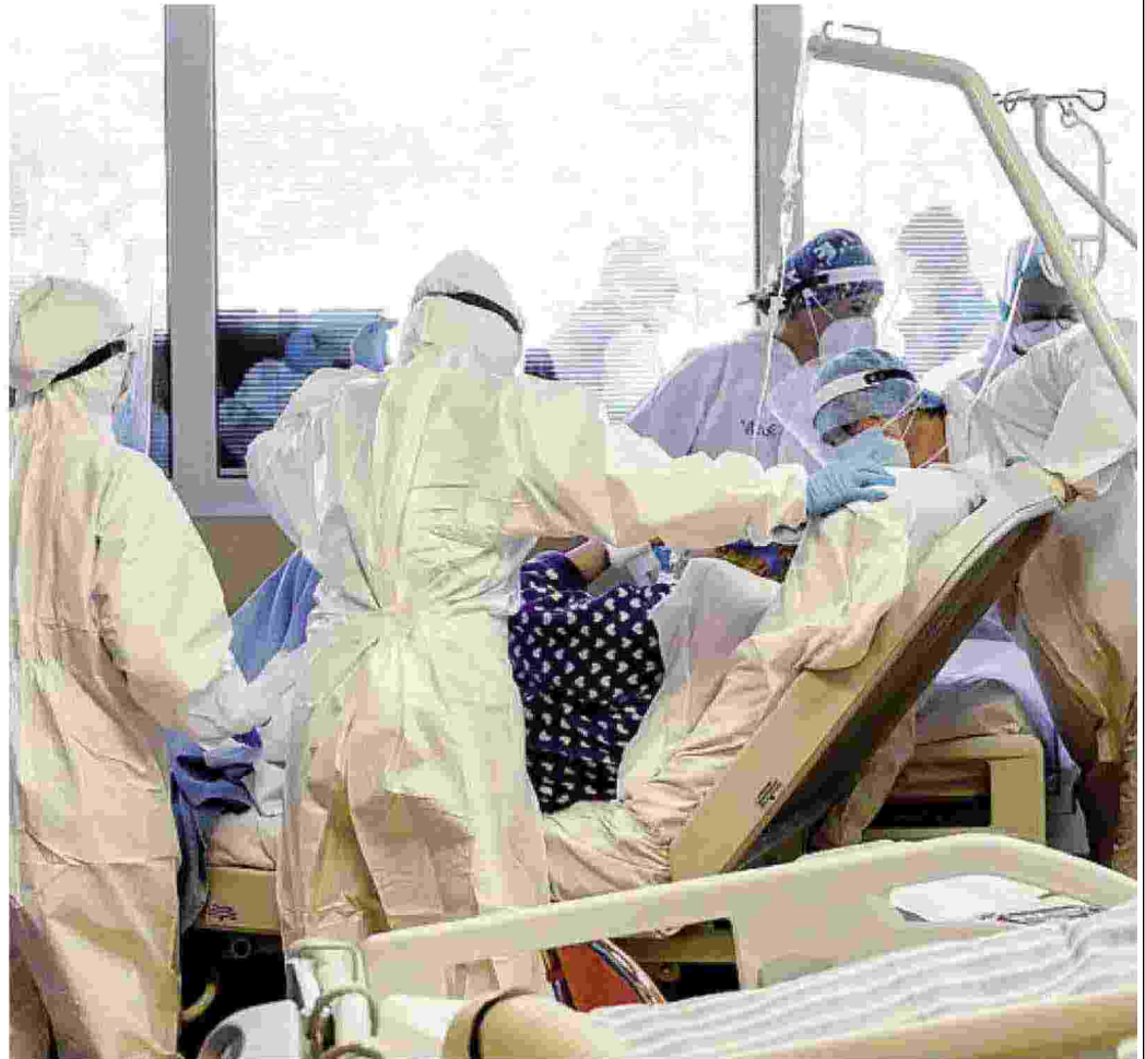
Medici e infermieri al capezzale di un malato di Covid in una terapia intensiva